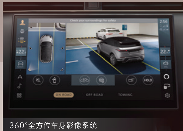
360°全方位车身影像系统

澎湃动力，启发城市潜力。轻混燃油版搭载沃德十佳英杰力涡轮增压引擎，最大功率达 249 马力，扭矩高达 356 牛·米，轻点油门迅速响应，满足通勤、高速、全地形等多种需求。插电混合动力技术配备三种驱动模式，加持混合环保动力，更长续航，更短充电时间，30 分钟即可恢复 80% 电量。