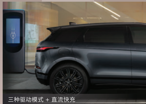
三种驱动模式 + 直流快充