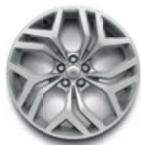
20英寸5辐铝合金轮毂 -样式5079