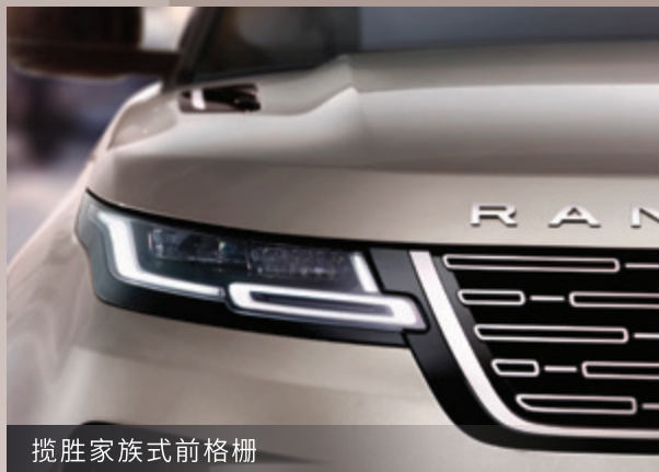
揽胜家族式前格栅