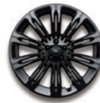
20英寸10辐熏黑效果铝合金轮毂 -样式1085

* 所提供的数据为车辆制造商依据有关欧盟法规测试的结果, 仅用于参考, 不应构成您购车决定的基础。CO 2 和燃油经济性数据可能因轮毂设置、选装的附加设备或者其他因素而异。技术参数、选装件和供应情况因市场不同而有所差异。所展示的内容不应作为您做出车辆购买决定的依据, 建议您在做出购买决定前莅临经销商处查看实车。