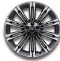
20英寸10辐亮光深灰撞色钻石切割铝合金轮毂 -样式1085