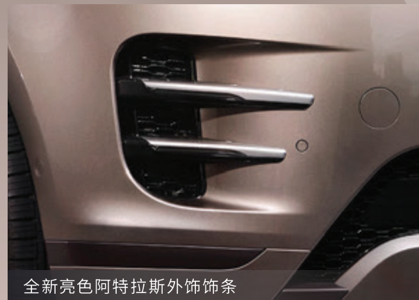
全新亮色阿特拉斯外饰饰条