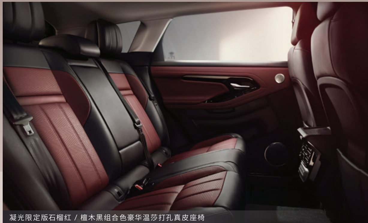
凝光限定版石榴红 / 檀木黑组合色豪华温莎打孔真皮座椅

搭载 650w 功率的 Meridian™ 英国之宝豪华环绕音响系统，自带 15 个扬声器，经 TRIFIELD 数字解码技术，将立体饱满听感传达到每个席位，沉浸体验剧院级声效。