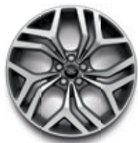
20英寸5辐钻石切割铝合金轮毂 -样式5079