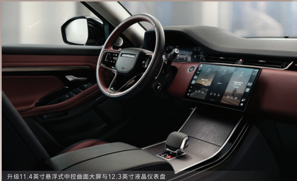
升级11.4英寸悬浮式中控曲面大屏与12.3英寸液晶仪表盘

同时，前排悉心配置无线充电与全车 4 个 45W Type-C 快充接口，畅行灵感旅程。