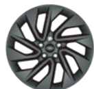
20" 哑光灰色铝合金轮毂 -样式5122