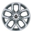
19" 铝合金轮毂 -样式5021