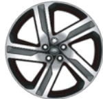
22" 亮灰色钻石切割铝合金轮毂 -样式5124