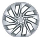
20" 铝合金轮毂 -样式5122