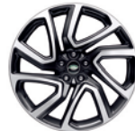
22" 哑光灰色钻石切割铝合金轮毂 -样式5025