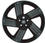
22" 亮黑色铝合金轮毂 -样式5124