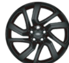
21" 亮黑色铝合金轮毂 -样式5025