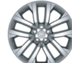
21" 铝合金轮毂 -样式5123