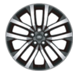
21" 亮灰色钻石切割铝合金轮毂 -样式5123